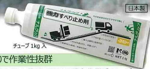
チューブ 1kg 入